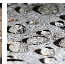
Вид поверхности после обработки гидрофобизирующим составом Sikagard®-703 W