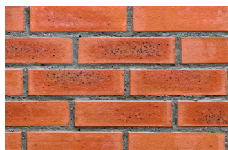
Кирпичный фасад после очистки