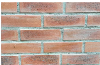
Кирпичный фасад до очистки