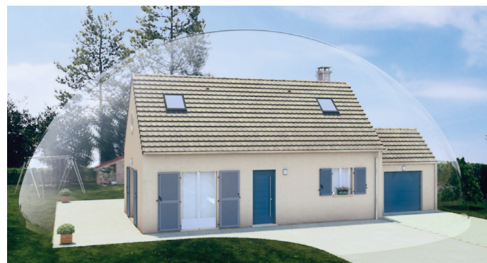
Поверхность обработана Sikagard®-703 W